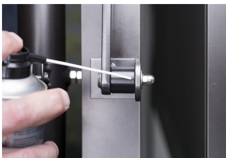
Lubrification de la poulie de renvoi (espaceurs)

Ne utiliser pas trop de vaporiseur, de sorte de éviter l'égouttement et les taches disgracieuses ainsi sur le terrasse.