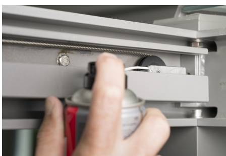
Lubrifier les Rouleau de guidage