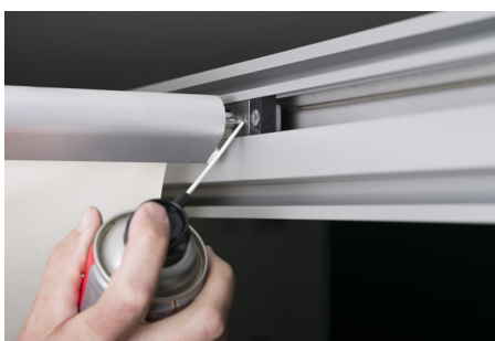
Graisser l'entraînement de guide