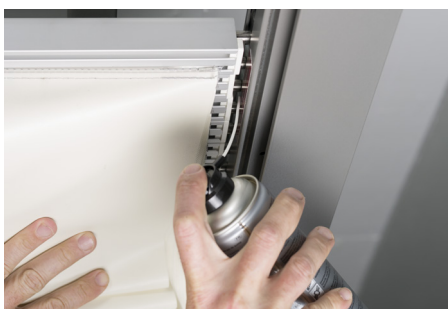
Graisser tous les axes coulissants