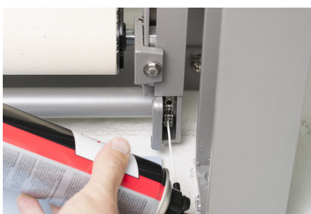
Graisser les engrenages